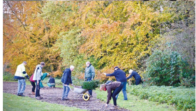
Samenwerken in groenontwikkeling