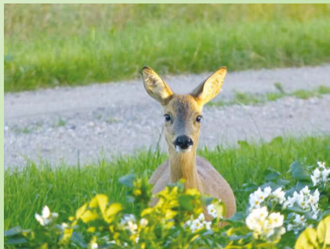
Natuur in de stad